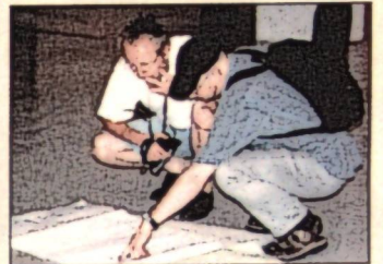
Svatko je imao svoj nacrt za projekt 'Plus-minus'