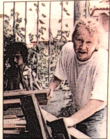
Umjetnik Vlado Franjević u stvaralačkom zanosu