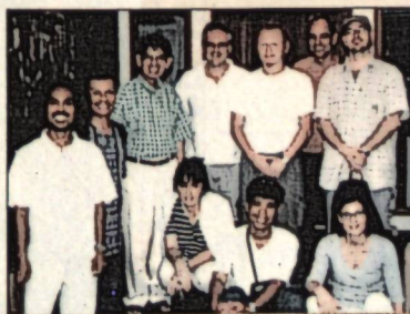
Slikar sa svojim studentima nakon izložbe njihovih radova