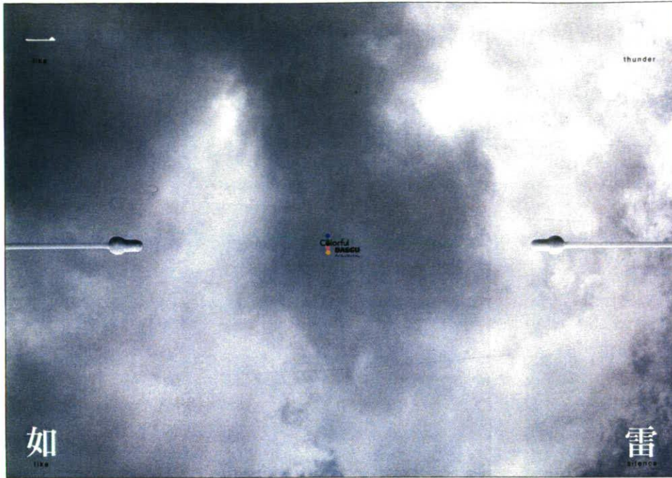
Tsang Tak ping Hong Kong