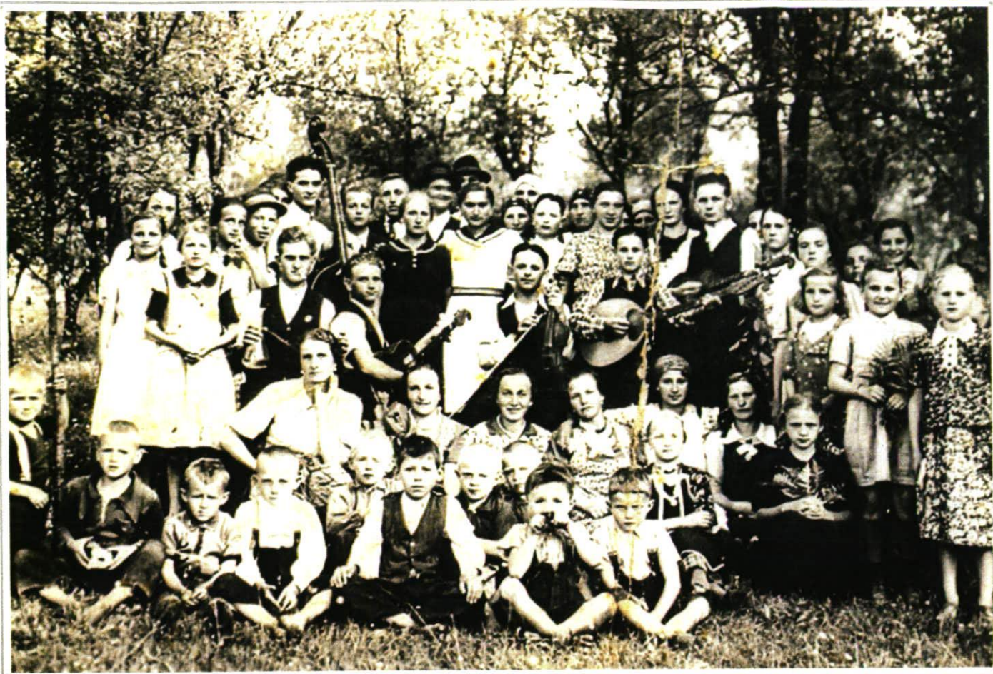
Suhaja 1944., nedjeljno kolo - "škola plesa"