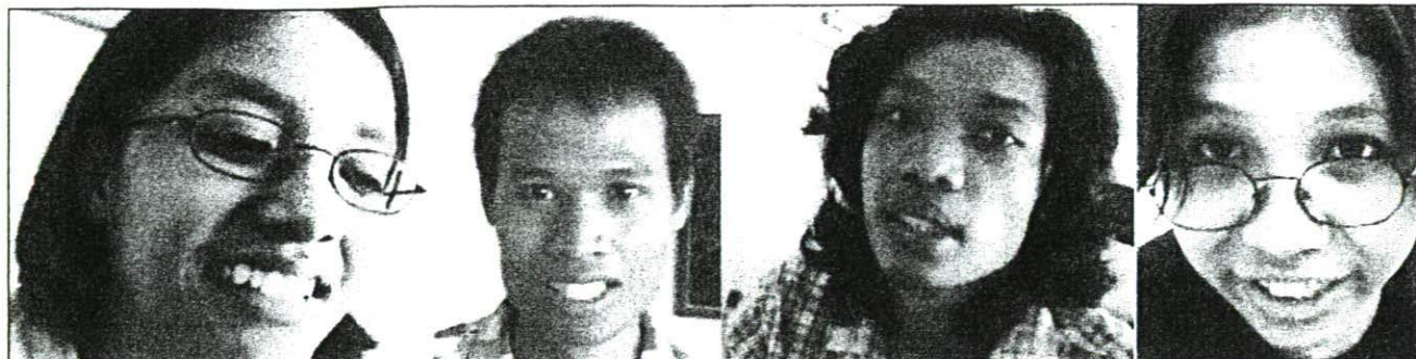
Die Studenten der Kunstakademie wurden zu Freunden.