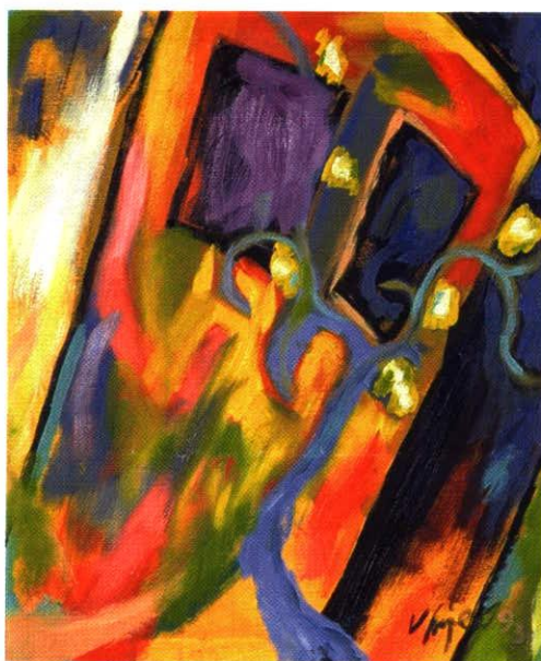
iza narancinih cvijetova / Hinter den Orangenblüten